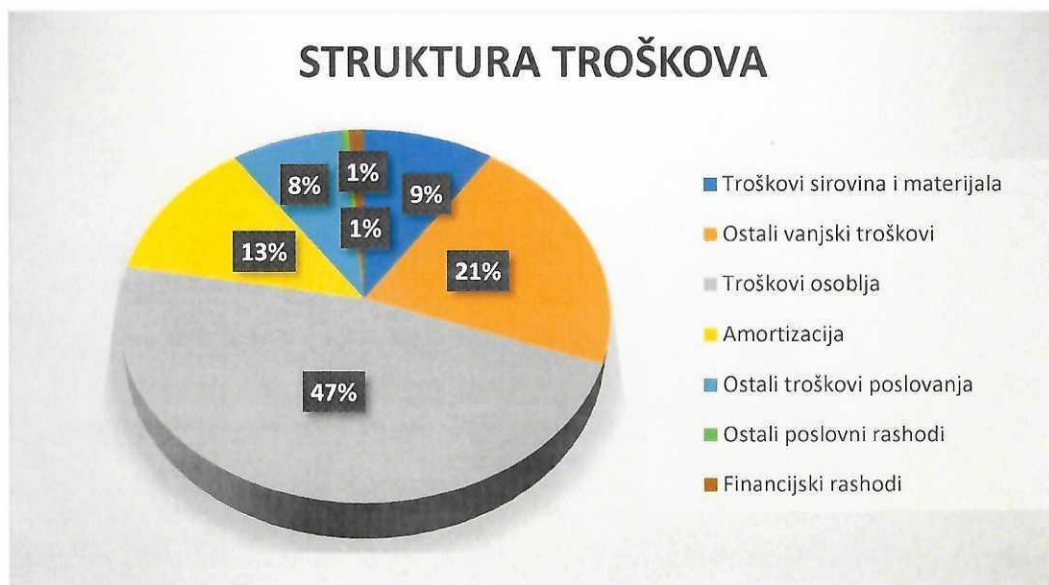
Grafikon br. 2. struktura troškova u 2025. godini